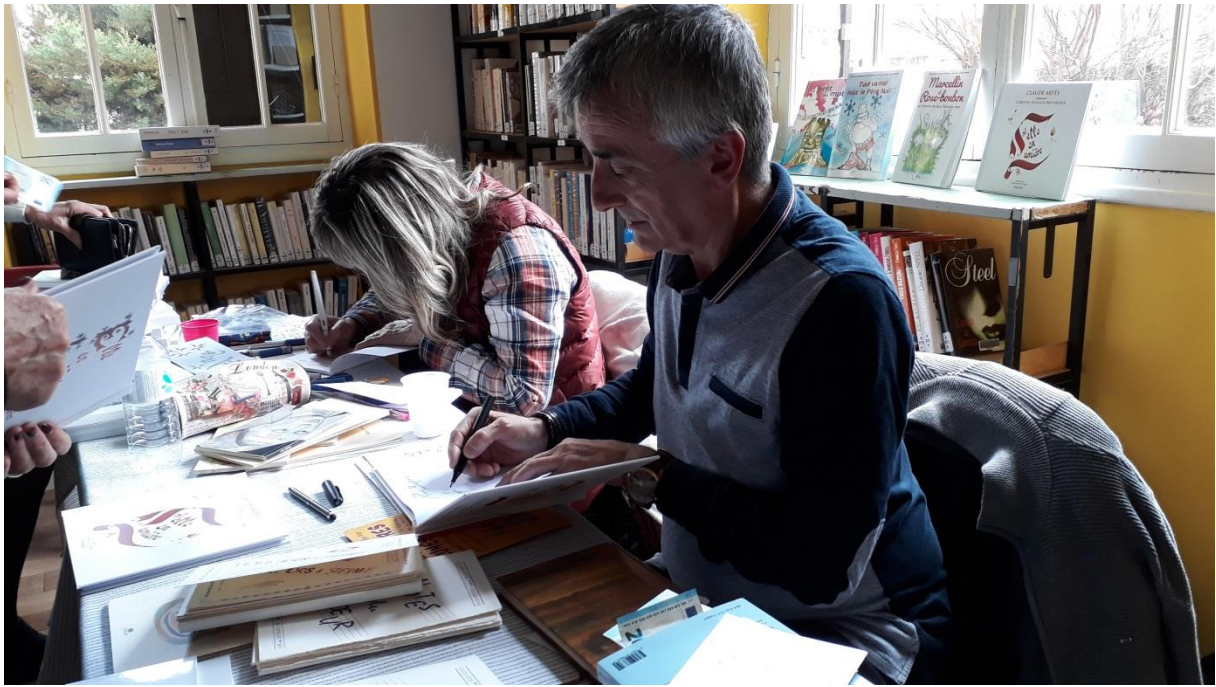
Les deux artistes en séance de signatures de leurs ouvrages à la Bibliothèque Pour Tous