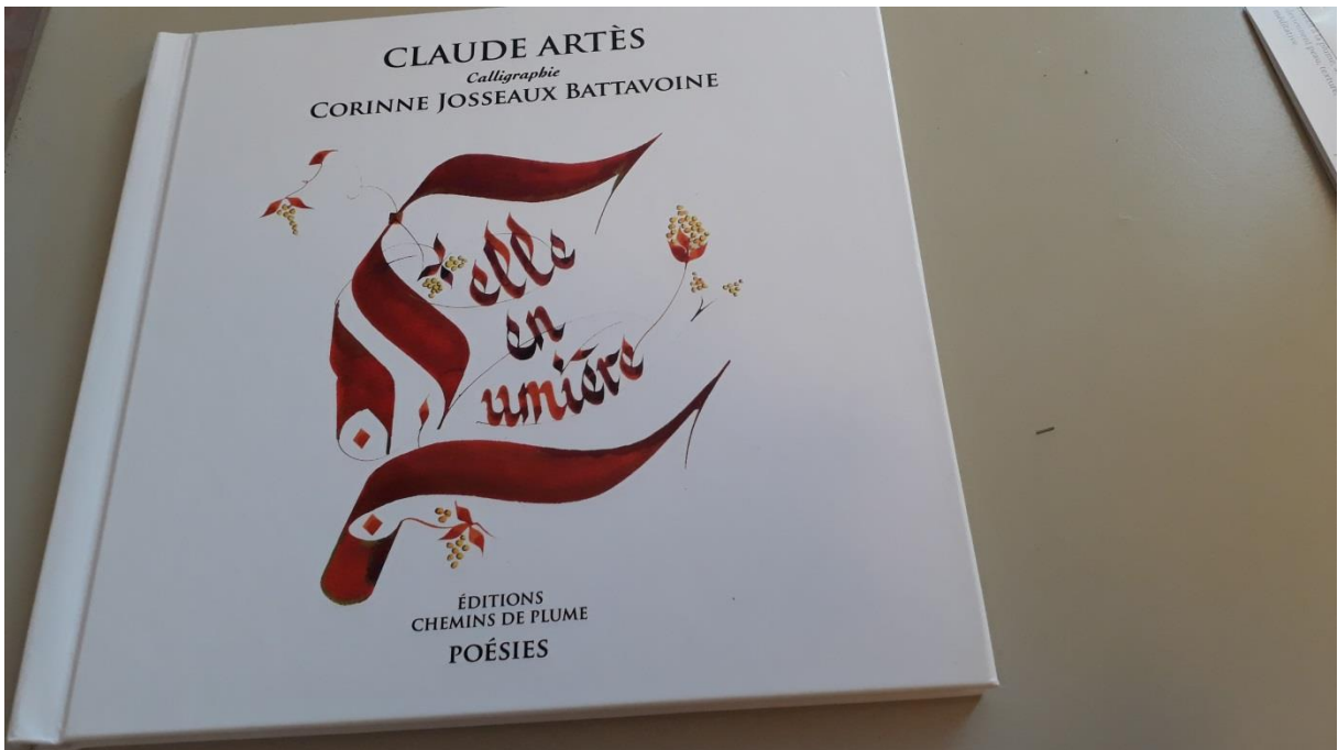
La couverture de « ELLE EN LUMIERE »